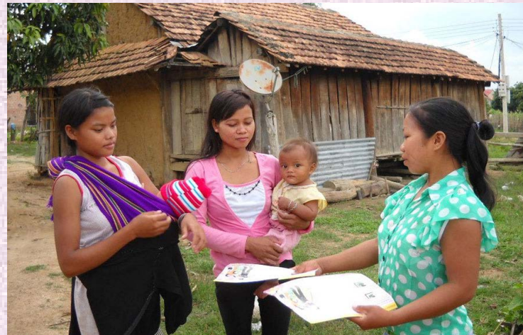
Tảo hôn ở các vùng sâu, vùng xa

hệ hoặc mẫu hệ, không bảo đảm quyền bình đẳng giữa vợ và chồng, giữa con trai và con gái.