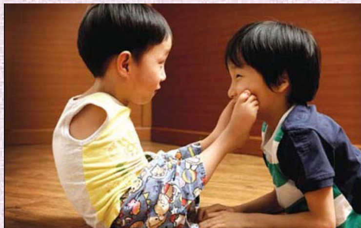
Hệ lụy từ việc hôn nhân cận huyết thống

Kết hôn của những người có họ trong phạm vi ba đời theo quy định tại Khoản 18 Điều 3 Luật hôn nhân và gia đình được hiểu là những người cùng một gốc sinh ra gồm cha mẹ là đời thứ nhất; anh, chị, em cùng cha mẹ, cùng cha khác mẹ, cùng mẹ khác cha là đời thứ hai; anh, chị, em con chú, con bác, con cô, con cậu, con dì là đời thứ ba.